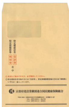
受診券送付用封筒