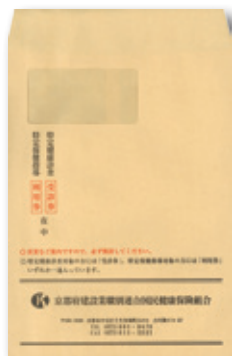
受診券送付用封筒