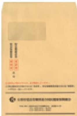
受診券送付用封筒